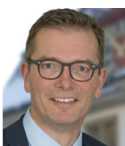
Consiglio nazionale Raphael Lanz, UDC Sindaco di Thun, Thun raphaellanz.ch