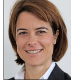
Consiglio nazionale Petra Gössi, PLR Giurista, Küssnacht am Rigi petragoessi.ch