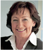
Consiglio nazionale Sylvia Flückiger-Bäni, UDC Imprenditrice, Schöftland politikerin.ch