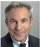
Consiglio nazionale Adrian Amstutz, UDC Imprenditore, Sigriswil adrian-amstutz.ch