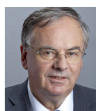
Consiglio nazionale Jean-François Rime, UDC Imprenditore, Bulle UDC.ch