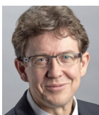
Consiglio degli Stati Albert Rösti, UDC Imprenditore, Frutigen albertroesti.ch