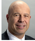
Consiglio nazionale Fabio Regazzi, PPD Imprenditore, Locarno regazzi.ch