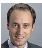
Consiglio nazionale Christian Wasserfallen, PLR Ing. mecc. dipl. HES, Berna cewe.ch