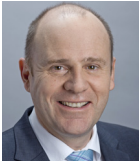
Consiglio nazionale Thomas Hurter, UDC Pilota, Schaffhausen thomas-hurter.ch