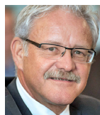
Consiglio degli Stati Beat Vonlanthen, PPD Consigliere di Stato, Fribourg beat-vonlanthen.ch