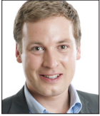
Consiglio nazionale Lukas Reimann, UDC Giurista, Wil lukas-reimann.ch