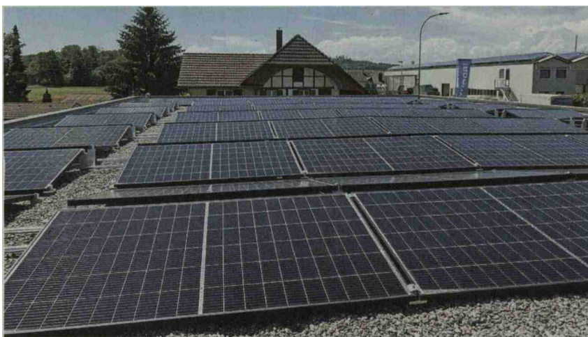
Rund 200 Quadratmeter beträgt die Fläche, die Anlage erzeugt gut 28 Kilowattstunden.

Obwohl die Fotovoltaik-Anlage ihre Idee war - sie passt laut Erich Roth ins Konzept von Hyundai. «Die Marke ist heute führend in Sachen Elektromotoren», erklärt er. Es seien sowohl Modelle mit Batterie als auch mit Wasserstoff-basierten Brennstoffzellen verfügbar. Hyundai lanciert zudem erstmals einen elektrisch betriebenen Lastwagen. «Heute verfügt fast ein Viertel aller verkauften Neuwagen über einen Elektroantrieb», gibt er zu bedenken. Die Thematik der Stromerzeugung rücke darum immer stärker in den Fokus. fko